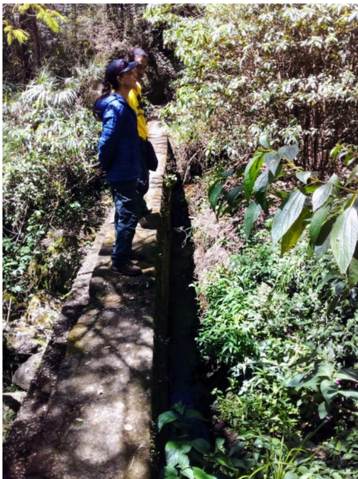
Fátima, voluntária e multiplicadora da SIMBiOSE.

"Depois de uma visita piloto à Grotta Funda num lindo sábado pela manhã (23 de julho), vendo o trabalho dos voluntários da SIMBiOSE, naquele paraíso de beleza natural, eu pensei... Também quero ser voluntária aqui! E fui atrás, depois de um processo... Hoje (08 de outubro) passei o dia na grotta!