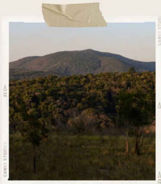
Vista da Serra do Itapetinga, por Karina Iliescu

Mande suas fotografias (ou compartilhe o link do álbum) para comunicacao@simbiose.org.br . E não se esqueça de informar o seu nome para os créditos!