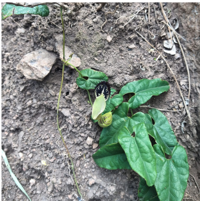
Planta carnívora difícil de ser encontrada