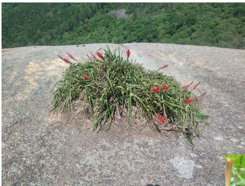
Floração de uma ilha de solo